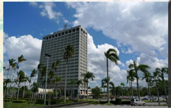
Bangunan Tunku Abdul Rahman (Wisma Bapa Malaysia Petra Jaya)