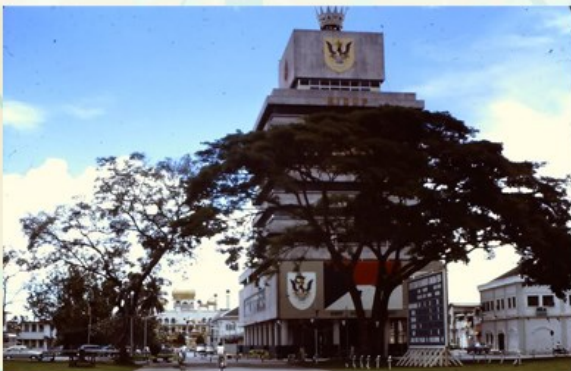
Bangunan Setiausaha Kerajaan Negeri ( Yayasan Sarawak )