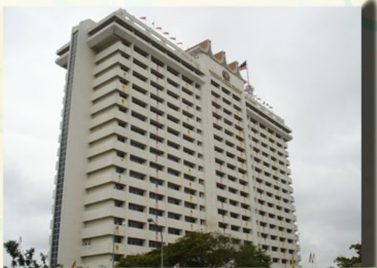
Bangunan Tunku Abdul Rahman (Wisma Bapa Malaysia Petra Jaya)